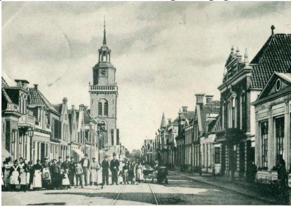
De Latijnsche school, het eerste pand rechts hier op de foto

In 't jaar 1695 werd in het dorp eene Latijnsche school opgericht, waarvan 't rectoraat aan den predikant was opgedragen. In oude bescheiden echter van jaar 1617 wordt reeds gewag gemaakt van een rector scholae Jouranae, zoodat